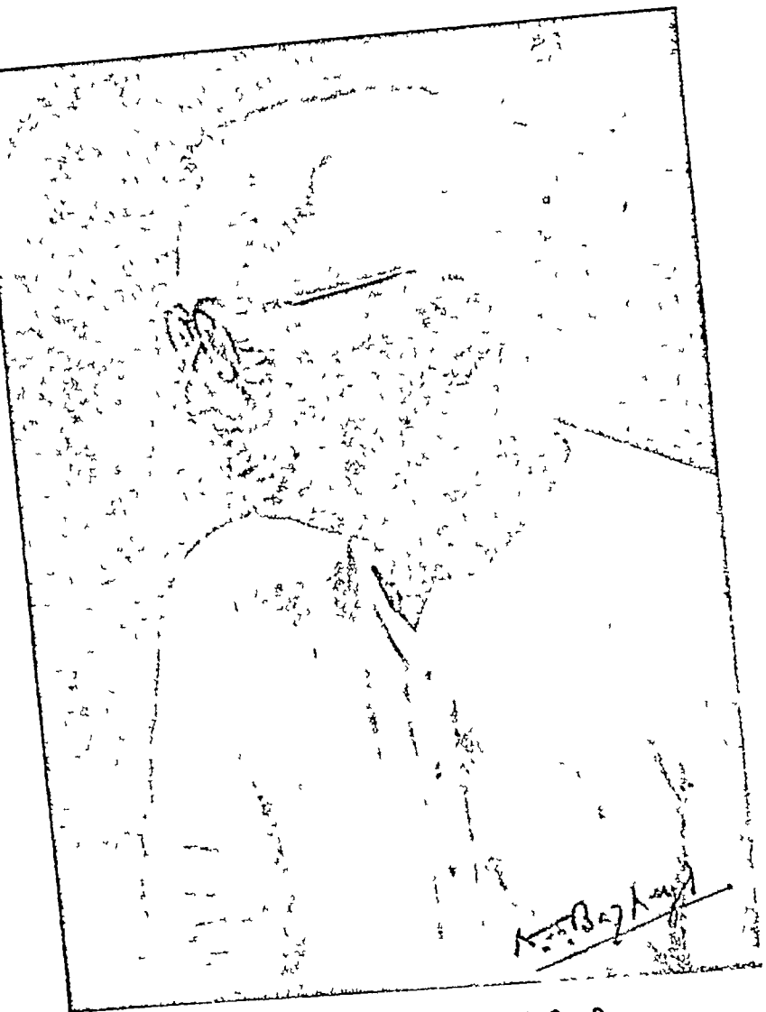
गुरुवर आचार्य नन्ददुलारे बाजपेयी जी